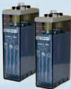
Рис.21 Аккумуляторы STARK OPzS

Современные технология и материалы обеспечивают высочайшую надёжность в течение всего срока службы. Срок службы OPzS блоков составляет 15 лет, срок службы элементов OPzS – 20 лет.