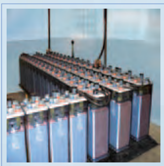
Рис.20 Смонтированная батарея Classic OPzS

снизить расход воды в ходе эксплуатации батарей OPzS и увеличить интервалы обслуживания до 1 раза в 3-5 лет.