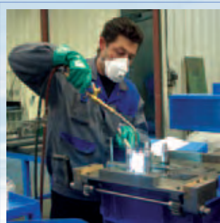
Рис.22 Производственный процесс