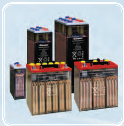
Аккумуляторы Classic OPzS